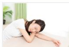
● 睡眠障害チェック