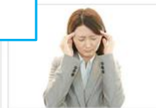
● メンタルチェック