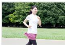
● 生活習慣チェック