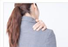
● 慢性疲労症候群チェック