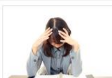
● 不安神経症チェック