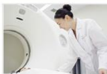
● 脳血管障害チェック