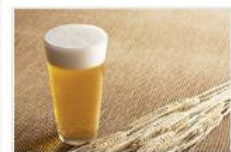
● アルコール依存度チェック